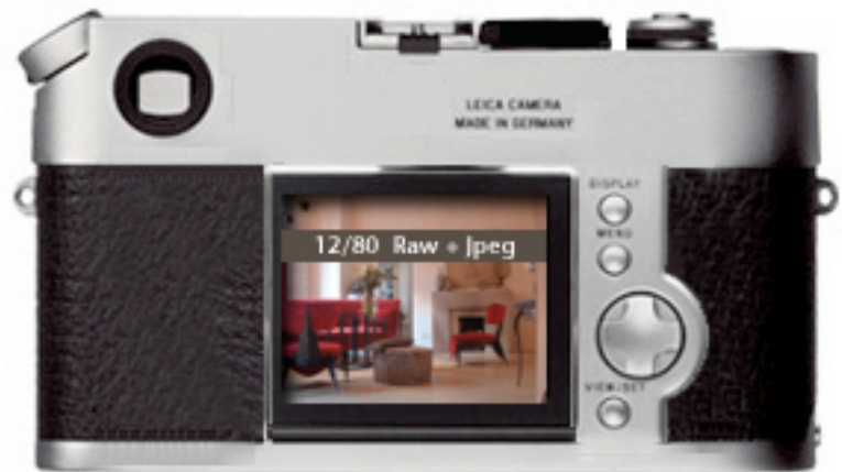
Ecran 2,5 "