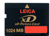
Stockage sur carte XD - 1 GO

Toute la gamme des objectifs de série M au service du numérique