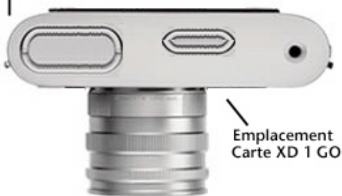
Emplacement Carte XD 1 GO