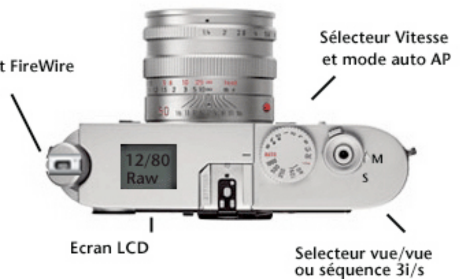
Sélecteur Vitesse et mode auto AP