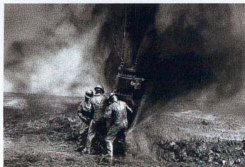
Le réglage manuel permet de maîtriser les conditions d'éclairage difficiles.